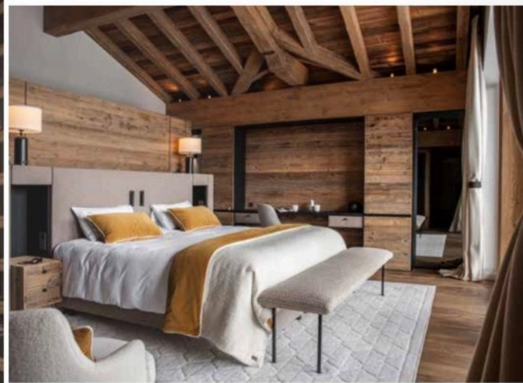
Sous les toits, la chambre master prend toute sa dimension. Son atmosphère feutrée est rehaussée par des touches de moutarde sur le plaid et les coussins.

I l l'a pensé dans les moindres détails. Sous l'évidence se cachent une réflexion profonde et un travail millimétré. Rémi Giffon a imaginé Le Chalet 1850 comme un retour à l'essentiel, mâtiné de délicatesse et d'élégance. Il revient sur cette épopée.