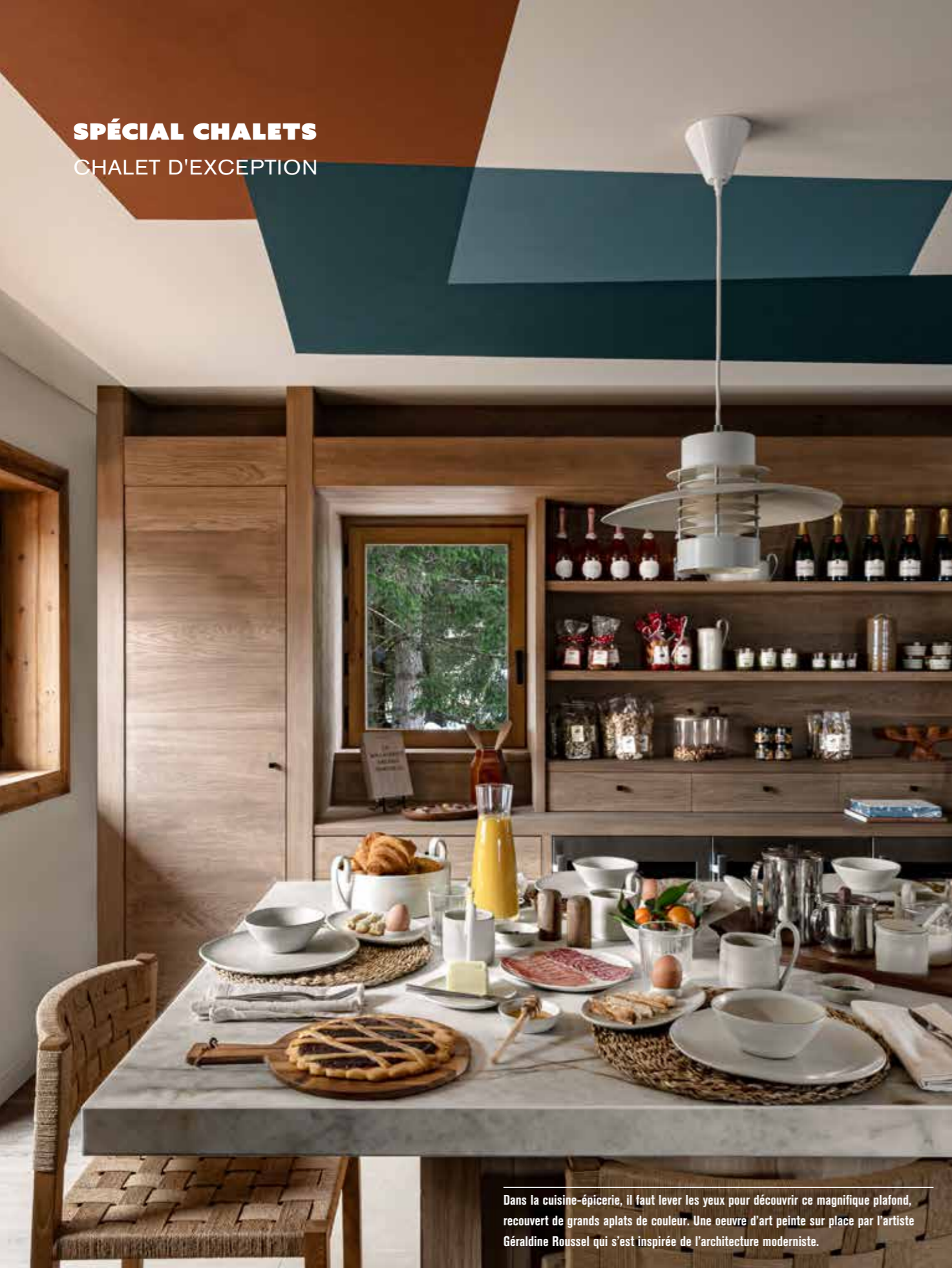
Dans la cuisine-épicerie, il faut lever les yeux pour découvrir ce magnifique plafond, recouvert de grands aplats de couleur. Une oeuvre d'art peinte sur place par l'artiste Géraldine Roussel qui s'est inspirée de l'architecture moderniste.

CUISINES • AGENCEMENTS • CONCEPTION D'INTÉRIEUR DÉCORATION • BOUTIQUE